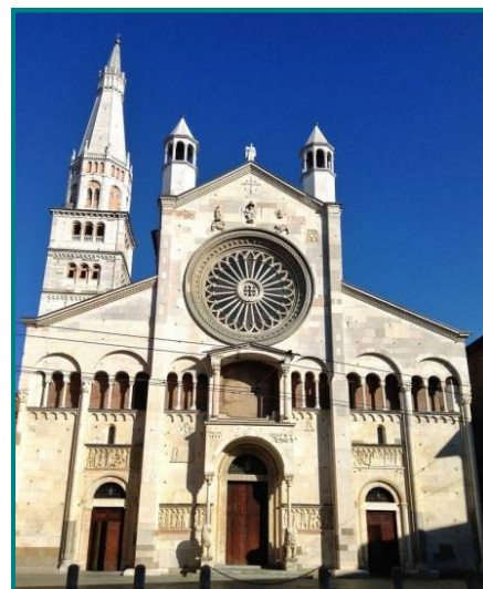
Nella foto la facciata del Duomo di Modena