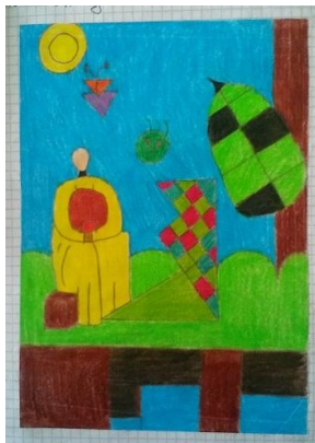
A medley of famous paintings